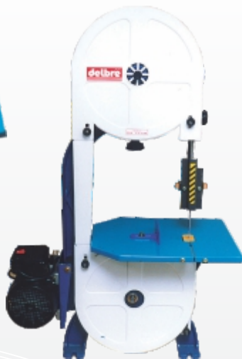
• DB 350 M